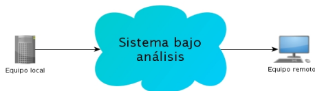
Fig. 2. Medidas de calidad.

además, brinda ciertos parámetros objetivos y subjetivos de calidad de servicio. Por otro lado, se configura mediante un fichero XML con la descripción de las pruebas a realizar y el modelo del tráfico a utilizar.